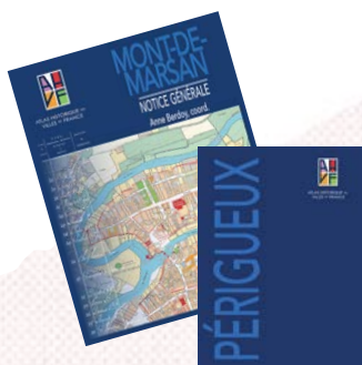
Atlas Historique des villes de France