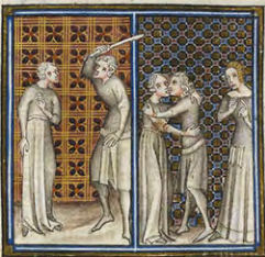
Bibl. François 9749 - Folio 89

Journée d'Étude organisée par les M2 Master Études Médiévales