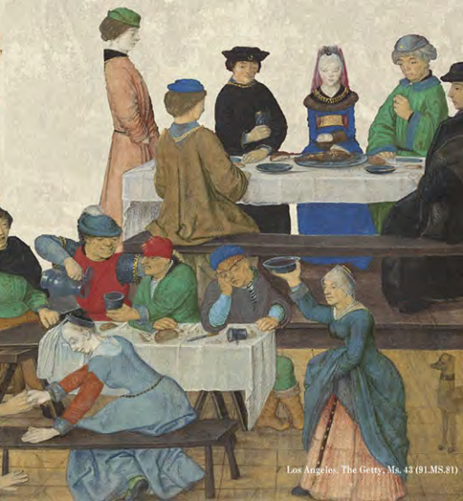
Los Angeles, The Getty, Ms. 43 (91.MS.81)

mens et c. Glose En ceste pte vale nus mer vne grant miracle. la quelle se lon mo' opinion eust mer son lieu ou premier liure ou chapitre des mirades que pa ⁊ est la sentence. que a rome auoit un temple dune dieuesse. la quelle et tot nomme virgylac . Et quant un liure vint es manes esto icelle. et il vo leu en re tantot faire en re fou aug en con